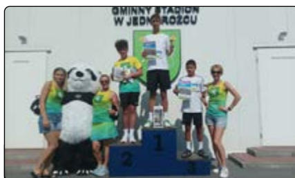
Zwycięzcy na dystansie 800 m