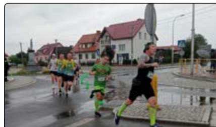
Trasa na 5 km bieglej przez centrum Jednorożca