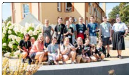
Uczestnicy warsztatów „Ocalić Jednorozca”

Niektórzy tak właśnie postrzegają inwestowanie czasu w szkolenie się, choć część takich spotkań jest organizowana online albo jest zaproponowany zwrot kosztów dojazdu lub nawet dowóz na miejsce. Wówczas jedynym kosztem jest czas. Warto go jednak zainwestować, bo jeśli chcemy działać i brakuje nam na to środków, to pomoże nam każde szkolenie. Spotkania z trenerami i wykładowcami to często nawiązywanie kontaktów, to podpowiedzi od wieloletnich praktyków, którzy zjedli przysłowiowe