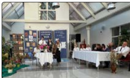
Uczniowie odczytują przydzielone fragmenty

kelriedyzmu, które zachęca do bohaterkiej walki aż do samego końca. Lektura nawiązywała do powstania listopadowego i przyczyn jego klęski.