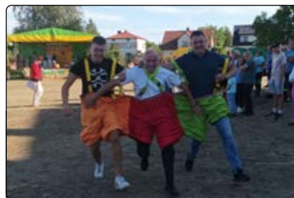
Sołtysiada – „Tor Farmera”