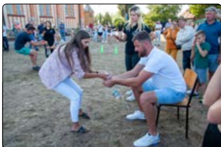
Sołtysiada – „Przelewanie wody”