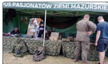
Korpus Pasjonatów Ziemi Mazurskiej