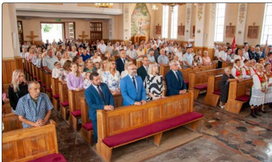
Dożynkowa msza święta