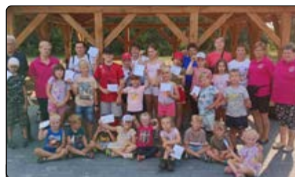
Wspólne zdjęcie na zakończenie półkolonii