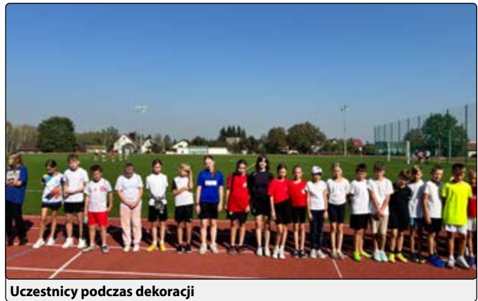
Uczestnicy podczas dekoracji