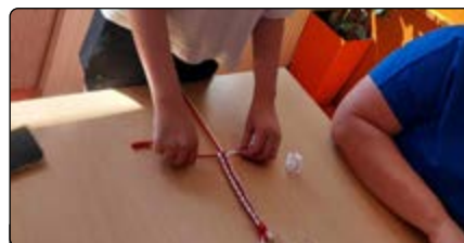
Uczestnicy wykonali breloki w białoczerwonych barwach

Natomiast 1 sierpnia, w 80. rocznicę wybuchu powstania warszawskiego, spotkaliśmy się w bibliotece w Jedno-