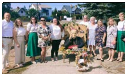
Zdjęcie grupowe lokalnych przedstawicieli z wójtem gminy