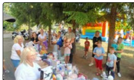
Kiermasz z licytacją dla naszego kolegi