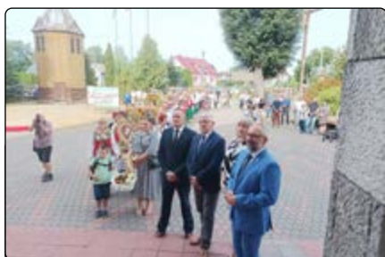
Korowód dożynkowy przed kościołem