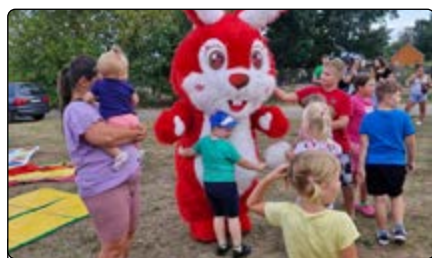
Zabawy animacyjne dla dzieci