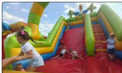
Dmuchańce cieszyły się dużym zainteresowaniem

zespoły „Kalina” i „Kurpie”, a na koniec zagrała Młodzieżowej Orkiestra Dęta ze Starej Krępy. Nie mogło zabraknąć zabawy tanecznej pod chmurką, co stworzyło niezapomnianą atmosferę.