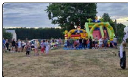
Dmuchałe atrakcje to frajda dla dzieci