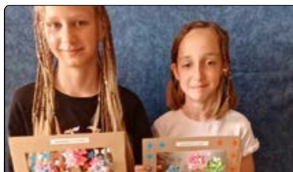
Warsztaty z okazji Dnia Taty w GBP

Nie były to jedyne wakacyjne propozycje biblioteki. W naszych placówkach i filiach odbyły się różnorodne spotkania. Rozpoczęliśmy od warsztatów z okazji Dnia Taty. W bibliotece w Jedno-