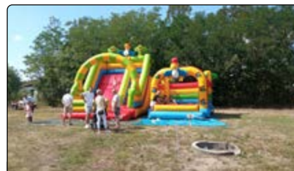
Dmuchańce dla dzieci

i dorośli mogli spędzić niedzielne popołudnie w miłej, rodzinnej atmosferze.