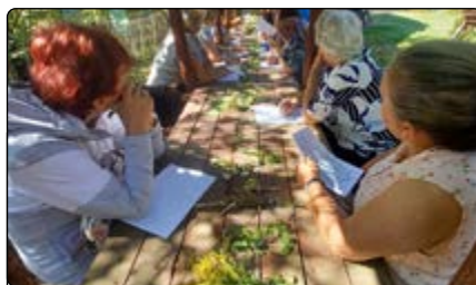
Warsztaty z ziołolecznictwa

Dzięki współpracy z LGD „Północne Mazowsze” odbył się wyjazd w ramach wizyty studyjnej pod nazwą „Barwna