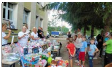
Wielkie serducha dobrych ludzi

Przy okazji festynu bardzo chcieliśmy pomóc naszemu koledze z koła, który jest ciężko chory. Dzięki dobroci ludzi zorganizowaliśmy kiermasz i licytację. Rzeczy na kiermasz zostały zebrane w ciągu dwóch dni, a odzew ludzi był