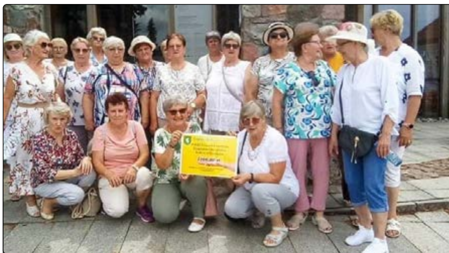
Seniorzy w domu urodzenia Fryderyka Chopina w Żelazowej Woli

W dniu 12 lipca grupa 30 osób z naszej gminy udała się na wyjazd rekreacyjno-wypoczynkowy do Niepokalanowa, Żelazowej Woli, Nieborowa i Arkadii. Został zorganizowany przez zarząd koła w Jednorzcu. W Niepokalanowie zwiedziliśmy Sanktuarium NMP Wrzechpośredniczki Łask, obejrzelśmy ruchomą szopkę pod nazwą „Panorama Tysiąclecia”, Misterium Męki Pańskiej oraz kaplicę św. Maksymiliana Marii Kolbego i Muzeum Stażackie. W Żelazowej Woli widzieliśmy dom urodzenia Fryderyka Chopina i park znajdujący się przy dworze. W Nieborowie zwiedziliśmy natomiast piękny pałac, Manufakturę Majoliki i ogród. W Arkadii widzieliśmy ogród, w którym zachowało się kilka pięknych budowli m.in. Świątynia Diany. Wyjazd został zorganizowany w ramach realizacji zadania publicznego pt. „Druga