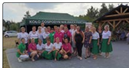
Zdjęcie grupowe sołtysów, radnych oraz KGW Dynak, Parciaki, Żelazna