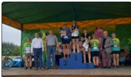
Zwycięzynie w NORDIC WALKING na dystansie 5 km wśród kobiet

3. Jakub Staśkiewicz z Łegu Starościńskiego, 20:22