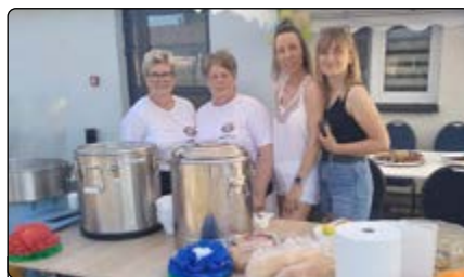
Członkinie KGW Dynak