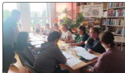
Szkolenie z Federacją ROSA

zęby w organizacjach pozarządowych (NGO) i jednostkach publicznych, to często doradztwo w różnym zakresie wybiegającym poza tematykę szkolenia. Zachęcamy do udziału w spotkaniach, szkoleniach czy wizytach studyjnych, bo każda wymiana doświadczeń to korzyść dla obu stron.