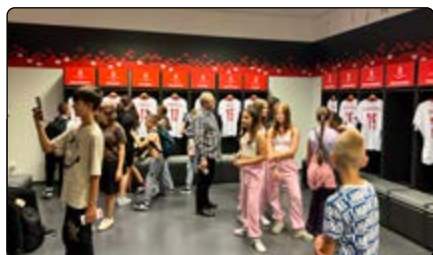
W szatni zawodników reprezentacji Polski

kadry. Zwiedziliśmy również centrum medialne dla mediów oraz sektor VIP. Na koniec wycieczki najwytrwalsi weszli na punkt widokowy i zobaczyli zapierającą dech w piersiach panoramę Stadionu Narodowego PGE.