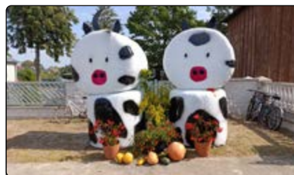
Dekoracja placu parafialnego