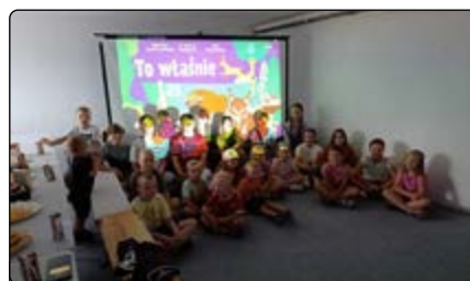
Projekcja bajki przyrodniczej