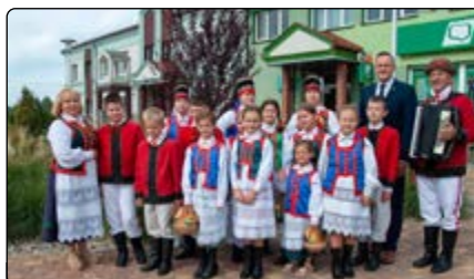
„Młode Kurpie” przed urzędem gminy