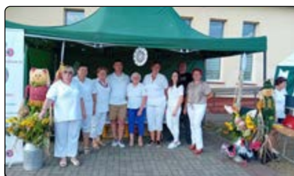
KGW z Ulatowa-Pogorzeli