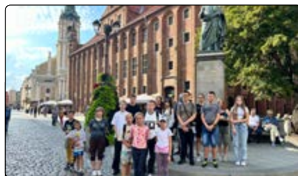
Przed pomnikiem M. Kopernika

Po wizycie w parku trampolin wybraliśmy się na spacer po toruńskim Starym Mieście. Zobaczyliśmy m.in. Krzywą Wieżę, pomnik Mikołaja Kopernika, fontannę ze złotymi żabkami, przepiękne kamienice mieszczące z XIII–XVIII w., Dom Mikołaja Kopernika oraz Bulwar Filadelfijski.