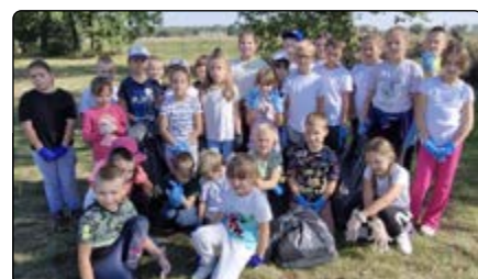
Sprzątanie Świata w Żelaznej

w 31. edycji Sprzątania Świata. W ten sposób promowane były działania na rzecz poszanowania środowiska oraz kształtowane postawy proekologiczne. Tegoroczna akcja przebiegała pod hasłem „Na straży czystej Ziemi”.