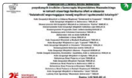
Gratulujemy pozyskanych prawie 150 tys. zł.

Także i my, zespół Gminnej Biblioteki Publicznej w Jednorozcu, korzystamy z takich szkoleń. Dzięki nabytym na nim umiejętnościom i wiedzy efektywnie pozyskujemy środki finansowe na realizację projektów. W dniu 26 czerwca poinformowaliśmy o pozyskaniu 30 tys. zł z Ministra Kultury i Dziedzictwa Narodowego w ramach