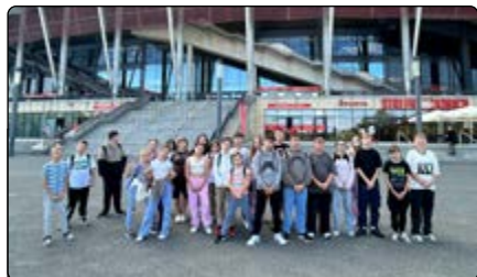
Uczniowie przed Stadionem Narodowym

zwykłych wizyt na Stadionie Narodowym. Mogli wejść m.in. do pomieszczeń strefy zawodniczej wykorzystywanych podczas meczów. Każdy uczestnik wycieczki mógł usiąść w szatni na miejscu swojego ulubionego zawodnika polskiej