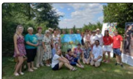
Na warsztatach z arteterapii