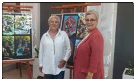
Seniorki przed wyborami Miss