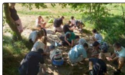
Dzieci szukają bursztynek

rozczy, by metodą makramy zrobić białoczerwone breloki. Tworzenie przedmiotów inspirowanych historią powstania miało na celu nie tylko rozwój manualny, ale także przypomnienie o wartościach patriotycznych w przystępny dla najmłodszych sposób. Powstało 13 małych dzieł sztuki, które będą nam przypominać o bohaterach, którzy walczyli o wolność.