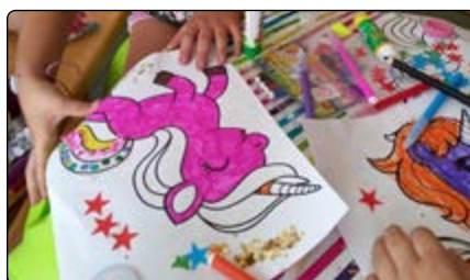
Konkurs na najładniejszego jednorozca

rozczy, w filii w Olszewce oraz świetlicy wiejskiej w Małowidzu dzieciaki kleiły, wycinały i rysowały, aż wykonały dla tatusiów 65 podarunków w postaci laurek i prac plastycznych.