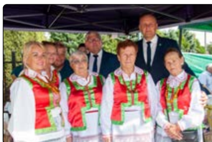
KGW w Jednoróżcu