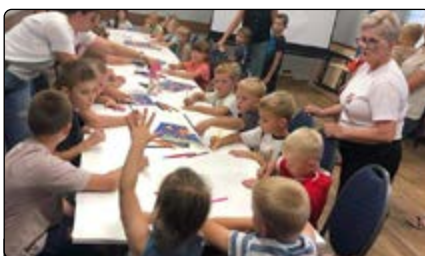
Warsztaty plastyczne dla dzieci

Na dzień 9 sierpnia 2024 r. zaplanowano spotkanie dla dzieci i rodziców. Panie z KGW w Dynaku przygotowały filmy przyrodnicze dla dzieci oraz przeprowadzi-