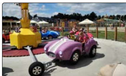
Bawimy się do ostatniej godziny