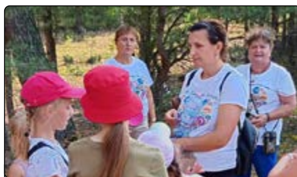
Odgadywanie zagadek przyrodniczych

Wszystko, co dobre, szybko przemija, więc i półkolonie dobiegły kresu. Były to chwile niepowtarzalne, które przyniosły wiele niezapomnianych wrażeń i dużo