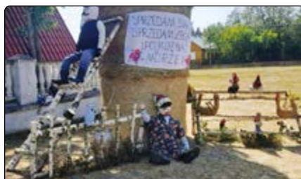
Dekoracja przy kościele