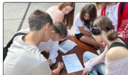
Wspólne rozwiązywanie zadania

Po przyjeździe do stolicy spotkaliśmy się z naszymi przewodniczkami, z którymi udaliśmy się na krótką wycieczkę po Warszawie. Podczas zwiedzania dowiedzieliśmy się, jak wyglądało życie Polaków w okresie międzywojennym. Następnie uczestniczący zostali podzieleni na zespoły, które rywalizowały w grze miejskiej. Otrzymali nietypowe i bardzo interesujące zadania do wykonania, w tym wiele ciekawych i twórczych zadań dziennikarskich.