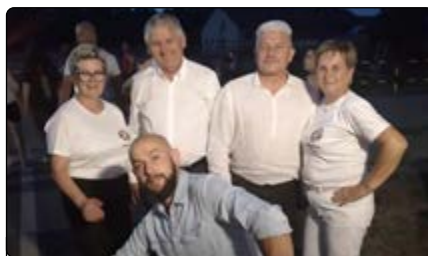
Tak się bawi Dynak

Na młodszych i starszych czekało mnóstwo atrakcji. Odbyły się liczne konkursy z nagrodami oraz zabawy integracyjne. Dużym zainteresowaniem wśród najmłodszych cieszyło się malowanie twarzy oraz dmuchany