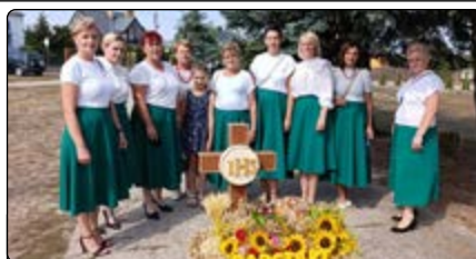
KGW Parciaki z wieńcem podczas dożynek parafialnych