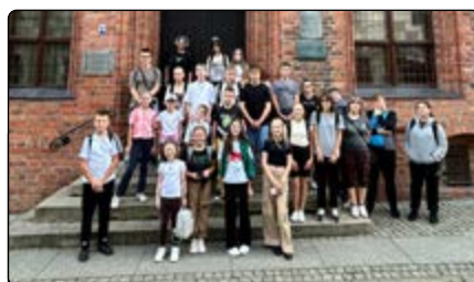
Przed Domem Mikołaja Kopernika

Pierwszym punktem wycieczki był park trampolin Jump Arena. Na terenie obiektu znajdują się liczne trampoliny, basen z gąbkami, ścieżki akrobatyczne i wiele innych atrakcji. Żeby uniknąć kontuzji, przed wejściem na główną halę uczestnicy wycieczki zrobili rozgrzewkę pod okiem trenerów. Wspólne skakanie wprawilo wszystkich w znakomity nastrój oraz wyzwoliło mnóstwo pozytywnej energii.