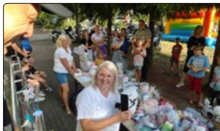
Licytacja pełną parą