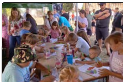
Warsztaty pod namiotem biblioteki