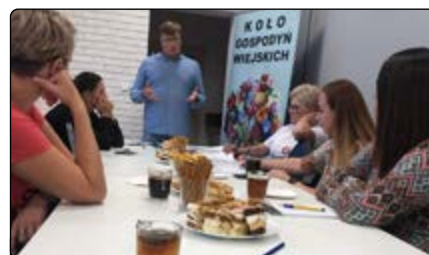
Szkolenie członków KGW

rozwijanie pasji i zainteresowań zarówno u dzieci, jak i osób starszych.