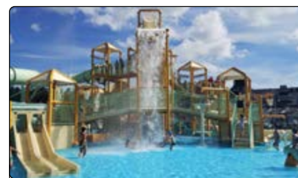
Park wodny w Julinku

cyjach, a jeszcze inni na karuzelach czy samochodzikach. W głowie wirowało od samego patrzenia na rollercoastery, ścianki wspinaczkowe i wiele innych atrakcji. Był po prostu szal. Bawiliśmy się do godziny 18.00, a w drodze powrotnej zmęczeni troszkę drzemaliśmy. Dojechalśmy cali i zdrowi.