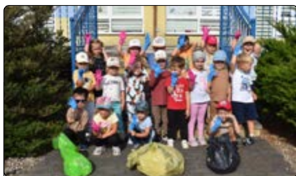
Dzieci z Przedszkola Samorządowego w Jednorozcu podczas akcji „Sprzątanie Świata”

Mamy nadzieję, że nasze działania przysłużą się planecie, będą dla innych dobrym przykładem oraz przyczynią się do większej dbałości o nasze lokalne środowisko.