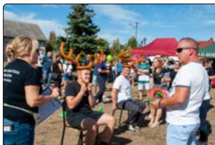
Sołtysiada – „Rzut do celu”