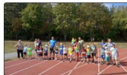
Start chłopców na dystansie 100 m