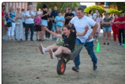
Sołtysiada – „Jazda z taczką”