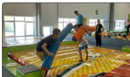
Uczniowie podczas wspólnej zabawy

W środę 18 września uczniowie z Parciak i Olszewki wraz z opiekunami wybrali się na wycieczkę do Torunia. Celem wyjazdu było propagowanie różnych form aktywnego wypoczynku, zainteresowanie ciekawą historią Torunia oraz integracja zespołów klasowych.