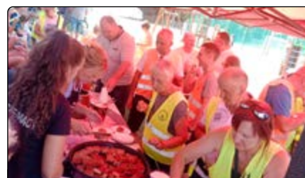
Nikt nie był głodny

Było nam wszystkim niezmiernie miło, że mogliśmy choć w małym stopniu – wspólnie z mieszkańcami i księdzem – ugościć pielgrzymów przed kolejnymi kilometrami, które mieli przebywać w drodze do Maryi w Archidiecezjalnym Sanktuarium Pasyjno-Maryjnym w Wejherowie.