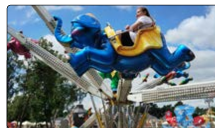
Atrakcje parku w Julinku

Takie aktywne wakacje to fajna sprawa, prawda? Polecamy.