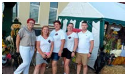
KGW „Lipianki” z Lipy