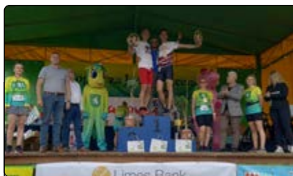
Zwycięzcy w NORDIC WALKING na dystansie 5 km wśród mężczyzn