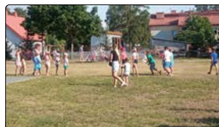
Dzieci integrowały się podczas zabaw

Serdecznie dziękujemy organizatorom za przygotowanie imprezy i zapewnienie świetnej zabawy. Dzieci, młodzież