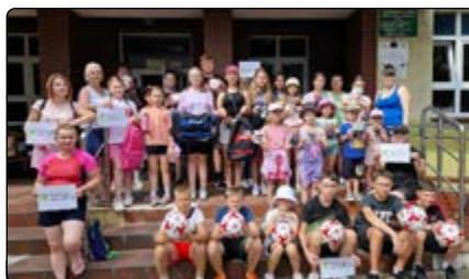
Uczestnicy Wakacyjnej Aktywacji 2024

Po dotarciu do Jednorozca rozegraliśmy mecz na boisku Orlik. Dzieciaki