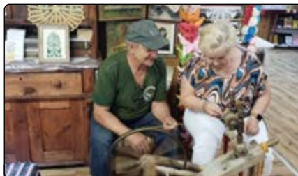
Nauka obróbki bursztynu

W sezonie letnim Gminna Biblioteka Publiczna w Jednoróźcu przy współpracy z jednoróżeckim wójtem, który użyczył busa, zorganizowała 8 wyjazdów dla seniorów z naszej gminy. Tematyka wyjazdów dotyczyła różnych sfer życia. Jeden to warsztaty pielęgnacyjne, podczas których uczestnicy mogli nauczyć się, jak dbać o swoją skórę w domowych warunkach. Dużym zainteresowaniem cieszyły się także zajęcia arteterapii w Skansenie w Nowogrodzie, gdzie sztuka stała się formą wyrażania emocji i relaksu. Obraz powstały na warsztatach wisi w siedzibie biblioteki w Jednoróźcu, gdzie można go podziwiać. Seniorzy wzięli udział również w gimnastyce słowiańskiej, której celem było poprawienie kondycji i wzmocnienie mięśni. Te