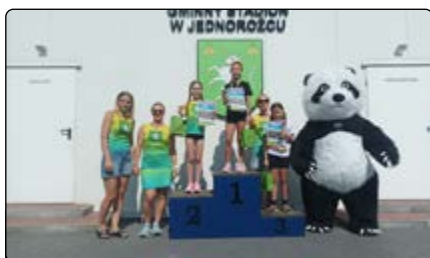
Zwycięzynie na dystansie 200 m

Organizator dziękuje pracownikom GZUK w Jednorozcu za pomoc w przygotowaniu zawodów, a medykom z Jednorozca za zabezpieczenie medyczne. Zadanie zostało sfinansowane z budżetu Województwa Mazowieckiego oraz dzięki wsparciu samorządu gminy Jednorozec.