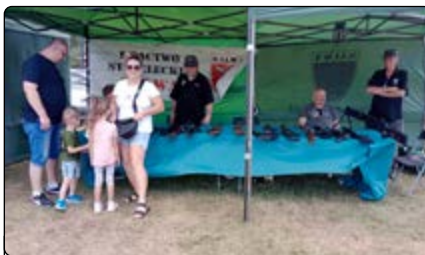
Stoisko bractwa strzeleckiego