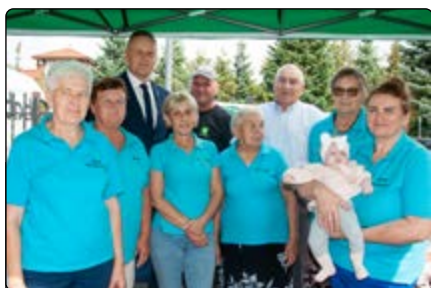
KGW Budy Rządowe

smacznymi potrawami, pracownikom GZUK za ogromną i niezastąpioną pomoc przy organizacji imprezy; OSP Jednoróżec za pomoc w organizacji; zespołom występującym na scenie, utalentowanym dzieciom i dorosłym, wreszcie wszystkim, którzy przyczynili się do organizacji i uświetnienia tego wydarzenia.