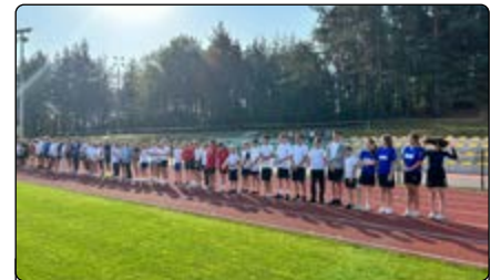
Przed rozpoczęciem zawodów w IBP