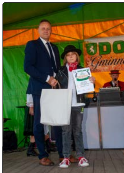
Występy młodych laureatów konkursu „Pokaż swój talent”