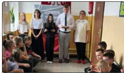
Uczniowie podczas lektury „Kordiana”

Uczniowie szkoły w Olszewce przystąpili do ogólnopolskiej akcji czytelnickiej „Narodowe Czytanie” mającej na celu popularyzację czytelnictwa, wzmocnienie poczucia tożsamości, zwrócenie uwagi na potrzebę dbałości o polszczyznę oraz propagowanie twórczości wybit-