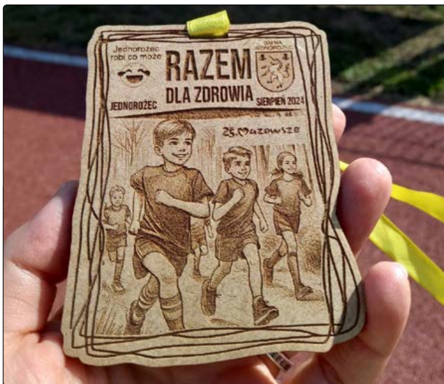
Medal, który otrzymali uczestnicy zawodów

Udział w biegu to nie tylko wysiłek i nagroda w postaci medalu, ale też poczęstunek regeneracyjny: soczyste arbuzy, banany, pyszna sałatka, popcorn, wata cukrowa, można było także spróbować pysznych lodów włoskich czy zimnej lemoniady. Na najmłodszych i starszych czekały atrakcje takie jak: dmuchańce, trampoliny, malowanie na strechu, bań-