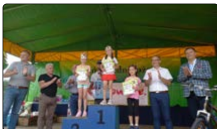
Zwycięzynie na 100 m w kat. przedszkolaki