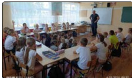
Spotkanie w Żelaznej Rządowej

We wrześniu odbyły się spotkania uczniów szkół w Żelaznej Rządowej,