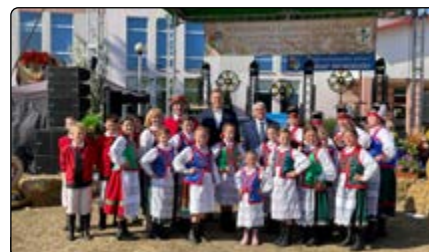
„Młode Kurpie” na dożynkach powiatowych

Kolejnej niedzieli, 8 września, odbyły się Dożynki Powiatowo-Gminne, połączone z obchodami 120-lecia Straży Pożarnej w Chorzelach. Zaprosiły nas władze powiatowe. Zaprezentowaliśmy