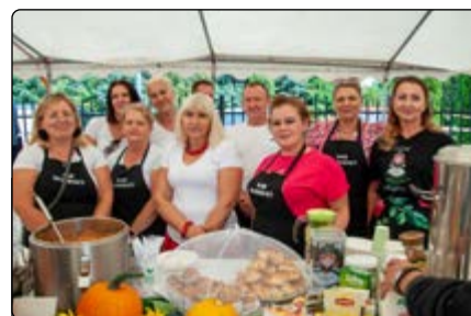
KGW w Olszewce „Olszewiacy”