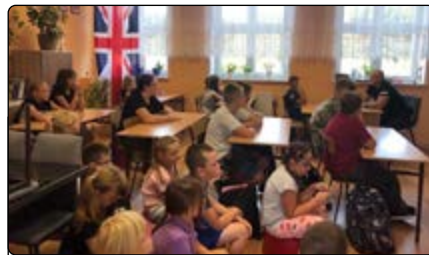
Spotkanie w Olszewce

szkoły. Policjant zapoznał uczniów z wrześniową akcją „Pomachaj kierowcy”, której celem jest zwiększenie bezpieczeństwa pieszych.