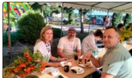
Spotkanie przy wspólnym stole

niesamowity. Można było wylicytować pluszaki, łyżwy, torebki, buty, kosmetyki, a nawet drona. Nie żalowano pieniędzy i padały zaskakujące kwoty. Zebrana kwota do puszek podczas całego festynu to aż 5 457,70 zł.