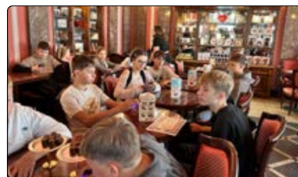
Z wizytą w wedłowskiej pijalni czekolady

Po tych zmaganiach udaliśmy się na posiłek do jednej z restauracji na Starym Mieście.