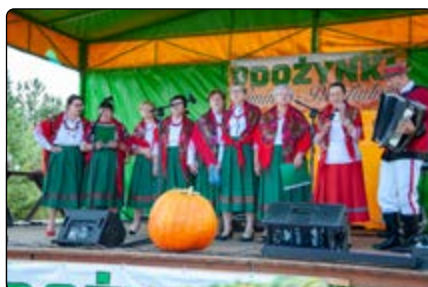
Występ KGW Żelazna Rządowa