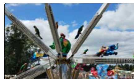
Karuzele dla małych i dużych