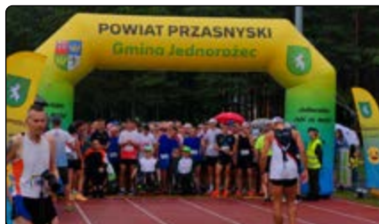
Rekord frekwencyjny uczestników – 673 osoby

naszych sportowców. Ci, którzy zgłosili wcześniej chęć stworzenia strefy kibica, oprócz gwizdków otrzymali kupony na lody włoskie i pamiątkowe gadżety.