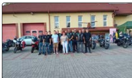
Motocykliści z Jednorożca