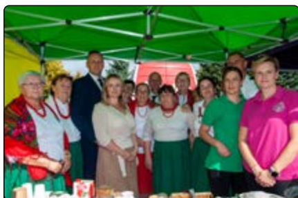
KGW Żelazna Rządowa