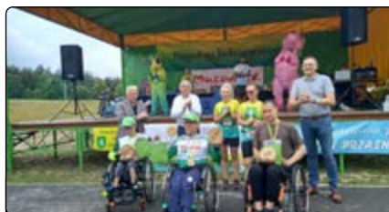
Zwycięzcy w kategorii WÓZKERSI na dystansie 5 km

W tym roku zawodników w bramie stadionowej witało dudnienie wielkiego bębna, które było slychać z daleka dzięki druhom strażakom z Lipy. Nie zawiedli nas też kibice, dopingując uczestników na trasie czy to okrzykami, czy dmuchając w trąbki i gwizdki. Nie było to łatwe zadanie, gdy padał deszcz, więc cieszymy się, że byliście i dopingowaliście