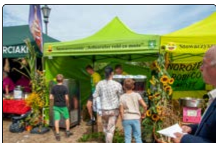
Stoisko „Jednorożec Robi Co Może”