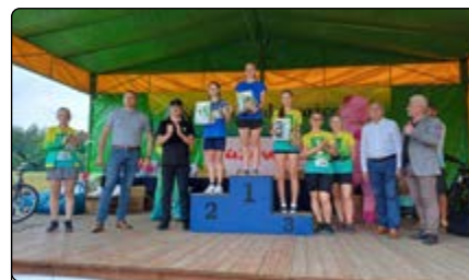
Zwycięzynie na dystansie 800 m wśród dziewcząt