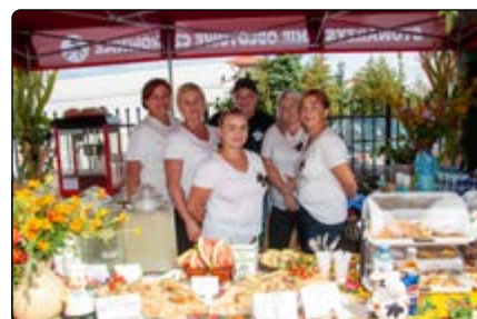
KGW w Lipie „Lipianki”