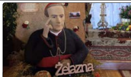
Wieniec dożynkowy Żelaznej