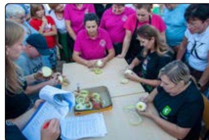
Sołtysiada – „Obieranie jabłka”