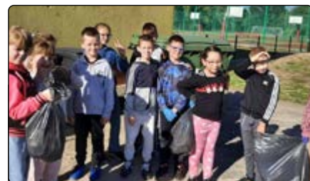
Sprzątanie Świata w Olszewce

Zgodnie z coroczną tradycją uczniowie szkół i przedszkoli z terenu naszej gminy wraz z opiekunami wzięli udział