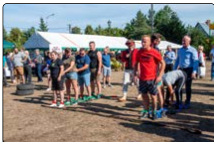
Sołtysiada – „Drużynowa jazda”