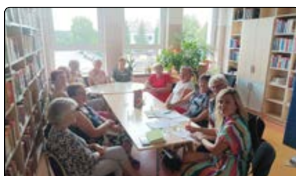
Konsultacje z MOWES

zęby w organizacjach pozarządowych (NGO) i jednostkach publicznych, to często doradztwo w różnym zakresie wybiegającym poza tematykę szkolenia. Zachęcamy do udziału w spotkaniach, szkoleniach czy wizytach studyjnych, bo każda wymiana doświadczeń to korzyść dla obu stron.