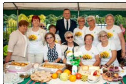
Koło Emerytów i Rencistów