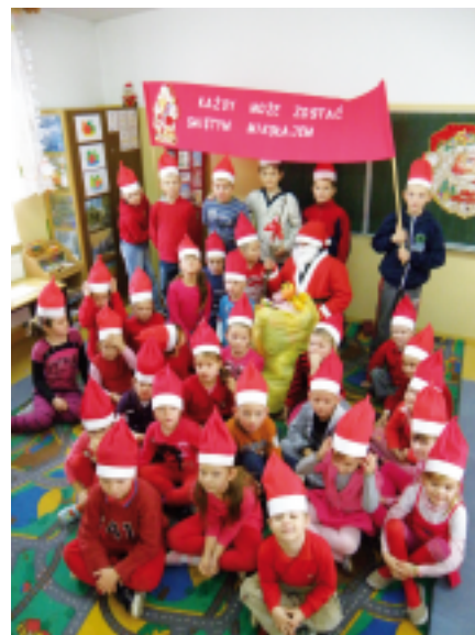
Mali Mikołaje z Ulatowa-Pogorzeli

Pomoc nie zawsze wymaga dużych wyrzeczeń. „Skarby” komuś już niepotrzebne, komuś innemu mogą sprawić wiele radości. Wiemy, że na świecie liczy się nie tylko własne dobro, ale także wrażliwość na potrzeby innych. Poprzez akcję udowodniliśmy, że mając niewiele, też można się dzielić. I mimo, iż nie zobaczymy uśmiechu dzieci, do których trafią zabawki, z pewnością w ten zbliżający się