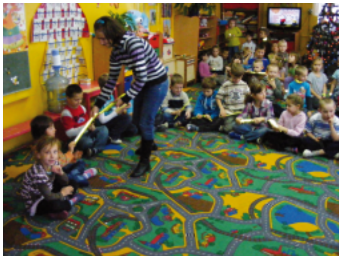
Przedszkolaki obdarowane odblaskami.

W szkole podstawowej dodatkowo przeprowadzony został konkurs plastyczny na temat „Bezpieczeństwo Ruchu Drogowego”.