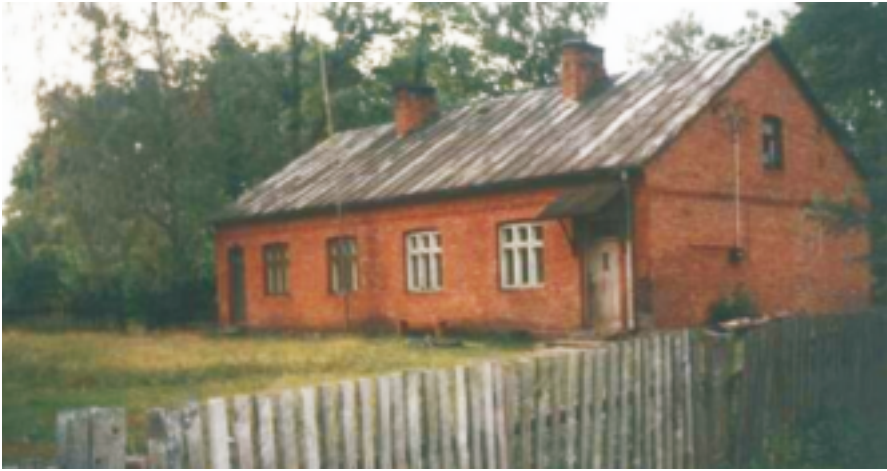
"Organistówka" - mieściła się tu szkoła do 1961 roku, a później przedszkole

obozów koncentracyjnych, w których zostało zamordowanych czterech nauczycieli, natomiast w obozach jenieckich przebywało dwudziestu nauczycieli.