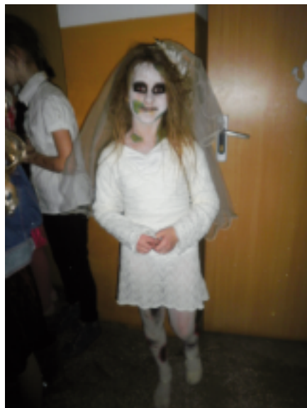
"Straszna" panna młoda

Halloween, to zwyczaj powszechnie znany i obchodzony w krajach anglojęzycznych. Dzień, w którym przypada to święto niemalże zbiega się z polskim Dniem Wszystkich Świętych i Dniem Zadusznym obchodzonymi 1 i 2 listopada. Nie można jednak łączyć anglosaskich zwyczajów z polską tradycją, halloween w Polsce jest obchodzony jedynie w ramach poznania obcych zwyczajów i kultur i w tym celu zorganizowana była