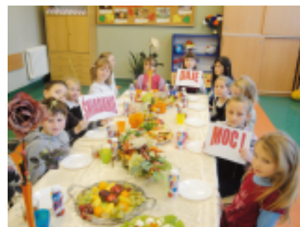
niadanie w kl. IIa.