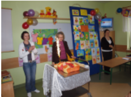
Tort urodzinowy Kubusia Puchatka

Kolejnym punktem programu były zabawy i misiowe konkursy. Dzieci zgadywały, kto gdzie mieszka w Stumilowym Lesie, dmuchały niebieskie baloniki dla Kubusia, rozwieszały pranie Kangu-