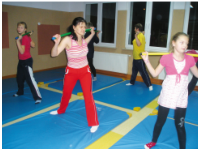
Zajęcia gimnastyczne w wietlicy Wiejskiej w Małowidzu