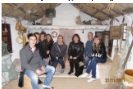
Uczniowie liceum z nauczycielkami j zyka angielskiego w chacie rybaka