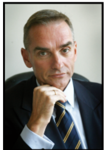
Senator RP Jan Maria Jackowski

Jak już wspominałem na wstępie, niepokojący jest stan świadomości obywatelskiej wielu rodaków. Demokracja, pomimo, iż nie jest systemem w pełni doskonałym stanowić może zaporę przed wszelkiego rodzaju skrajnościami. Każdy głos oddany w wyborach jest bardzo ważny. To od niego zależeć będzie przyszłość wielu pokoleń. Niestety wielu polityków w imię doraźnych interesów przerzuca wiele odpowiedzialnych decyzji i obciążeń na kolejne pokolenia, dlatego też oprócz bezkrytycznego wsłuchiwania się w za-