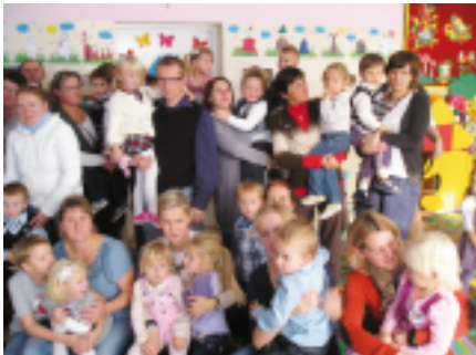
Dzieci 3 letnie wraz z rodzicami

i "Biedronki". Przybyli na tę uroczystość rodzice dzieci 3 i 4 letnich. Przedszkolaki