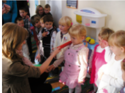
Dyrektor pasuje przedszkolaków

27 i 28 października w przedszkolu w Jednorozcu odbyło się "Pasowanie na Przedszkolaka" w grupie "Muminki"