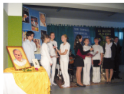
Młodzie podczas pieśniania pieśni

Tegoroczny XI Dzień Papieski został przygotowany przez gimnazjalistów