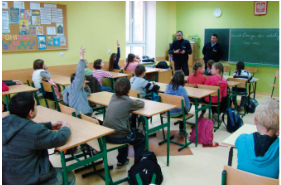
Spotkanie z funkcjonariuszami Policji.

W Szkole Podstawowej w Jednorozcu odbyło się spotkanie funkcjonariuszy Policji z Wydziału Ruchu Drogowego z uczniami klas czwartych. Spotkanie miało na celu przypomnienie uczniom zasad bezpiecznego poruszania się po drogach pieszo, jak i rowerem. Policjanci główny nacisk kładli na świadomość noszenia przez uczniów odblasków (kamizelek, naszywek lub opasek odblaskowych). Zwłaszcza teraz w okresie jesienno-zimowym, kiedy to o wczesnej porze zapada zmierzch, odblask może uratować życie dziecka. Dzieci nie były świadome, że nosząc ciemne ubrania, wieczorem mogą być zauważone przez kierowców pojazdów z odległości jedynie kilku metrów. Uczniowie chętnie uczestniczyli w dyskusji, zadawali sporo pytań związanych z ich drogą do i ze szkoły. Wiele pytań dotyczyło też egzaminu karty rowerowej, który w bieżącym roku szkolnym czeka właśnie czwartoklasistów. Policjanci pozytywnie ocenili wiedzę uczniów oraz ich chęć do